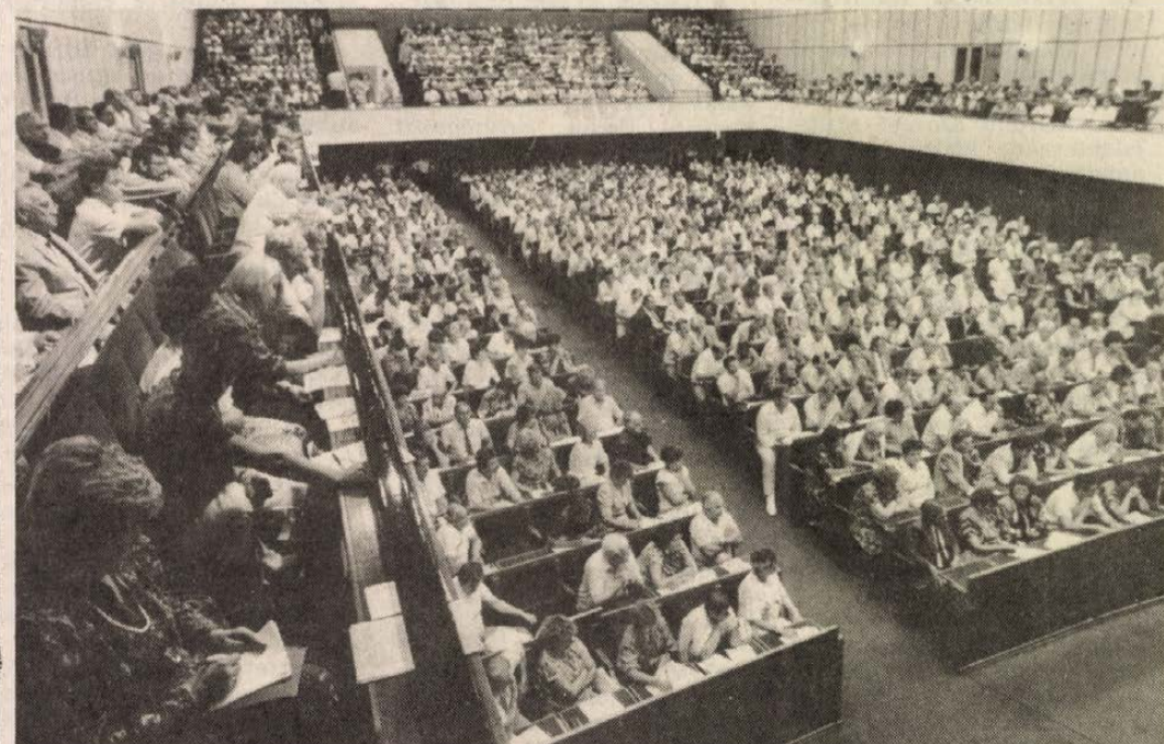
Zsúfolt ház az építőknél

Országos szakszervezeti tanácskozás — Engedetlenül várnak az Alkotmánybíróságra